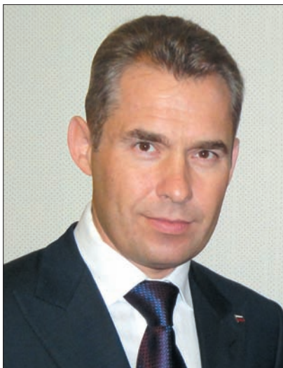
Павел Астахов Уполномоченный при Президенте Российской Федерации по правам ребенка

Борьба с насилием тесно связана с признанием основных социальных прав ребенка. Недостаточность или отсутствие признания социальных прав детей является самой серьезной помехой в борьбе с насилием над детьми.